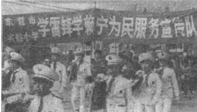
市实验小学广泛开展“学雷锋、学赖宁、奉献在东营”活动，经常组织学生深入到工厂、机关进行宣传和参加义务劳动。