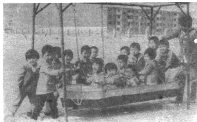
在国际“六·一”儿童节来临之际，我市为儿童组织了丰富多彩的娱乐活动，让孩子们充分享受自己节日的快乐和幸福。图为记者在市直幼儿园拍摄的一个镜头。