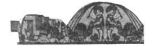
快乐的童年。刊头剪纸

采访结束时，只见刚刚粉刷过的墙壁白白的，油漆过的玩具亮亮的……一切都焕然一新。园中台阶上，一孩子正围坐在阿姨身旁，暖暖的阳光照在他们纯真的笑脸。孩子们，祝福你们！(张连玉)